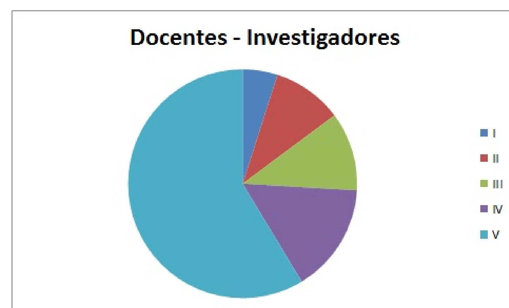
Figura 1: Docente-Investigador categorizado en el marco del Programa de Incentivos, por categoría - Año 2016

La Facultad de Ciencias Económicas cuenta con 162 docentes investigadores categorizados dentro del Programa de Incentivos Docentes y que pertenecen a los cinco Departamentos. A continuación, en la figura 1 y el cuadro 1 se muestra la composición de los docentes pertenecientes al Programa, desagregada de acuerdo a los criterios mencionados.