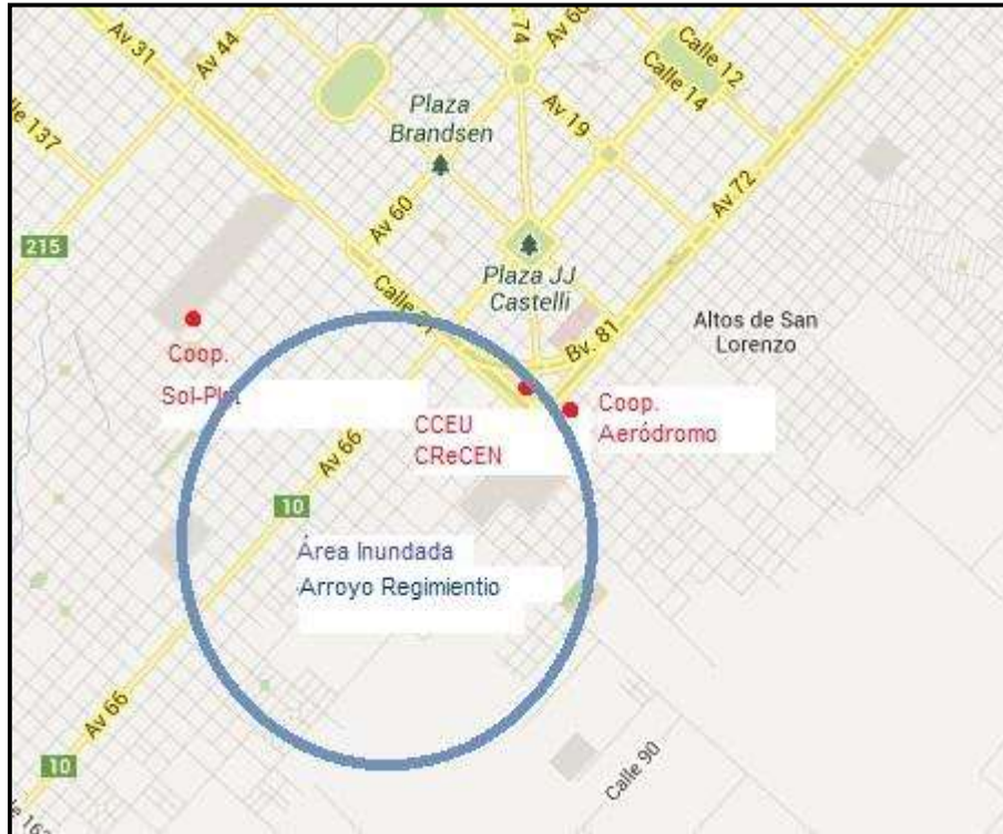
Imagen N° 2

Hornos, hasta la Cooperativa de Trabajo Sol Plat Limitada, ubicada en la intersección de las calles 57 y 139.